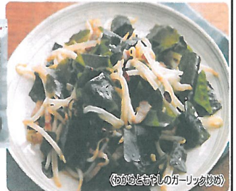
《わかめともやしのガーリック炒め》