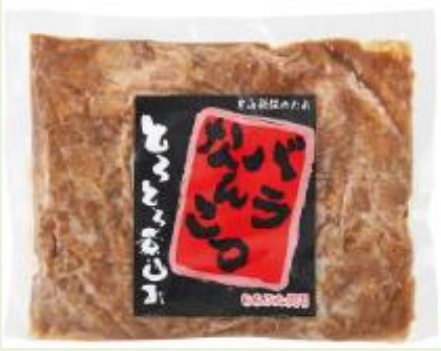
バラ軟骨とろとろ煮込み 200g