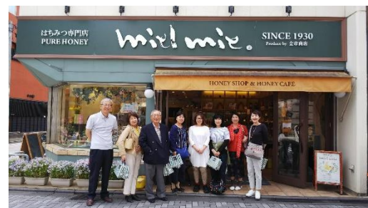
ミールミイ 三条店