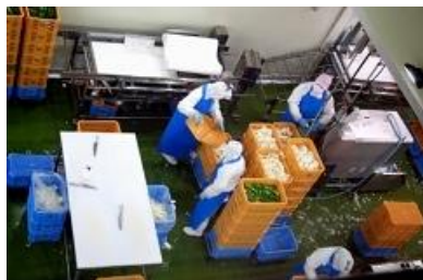
2階から見たところ

6月11日に組合員さんと賛助会員さんに呼びかけて、総勢7名で群馬県の板倉東洋大前駅にある、パルシステムの「板倉食品加工センター」を訪ねました。今、とても人気のある「パルシステムお料理セット」の野菜のカットから、食材のセットライン、検査、試作などの施設を備えていて、商品の開発から製造まで一貫した生産が可能です。まずは説明をお聞きして、動画を観せていただきました。そして2階から製造現場を見下ろすと、野菜のカットを手作業でされていました。お昼には実際に食材セットでお料理を作ってみました。レシピが入っていて、野菜もカット済み、調味料も入っているので、誰でも簡単に作れます。実際にお料理の経験のない参加者にも作っていただきましたが、ボリュームもあって美味しいお料理が作れました。お料理の入門に、お子様に作ってもらうのも良いかもしれませんね。ぜひ購入してみてください。